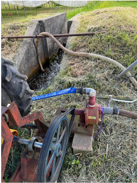
水路から耕運機を使用し、ポンプを回す