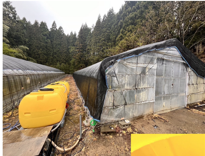
育苗ビニールハウスの横にタンクを設置